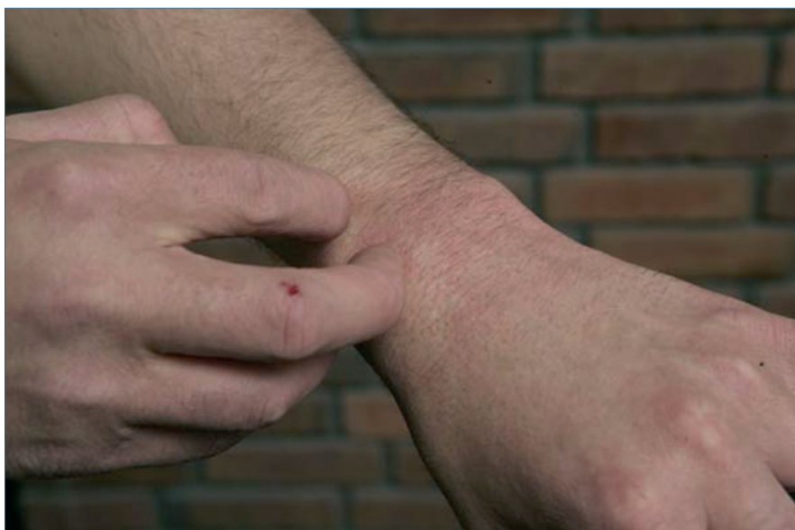
Abb. 1: Juckreiz ist das Leitsymptom bei Neurodermitis.

Neuerdings ist es möglich, diese Allergietypen indirekt zu unterscheiden. Es hat sich gezeigt, dass Hautgele, die ein Histamin spaltendes Enzym (DAO = Diaminoxidase) enthalten, bei IgE-vermittelten Nahrungsmittelallergien den Juckreiz lindern können. Weiterhin zeigt sich, dass siliziumhaltige Hautgels in